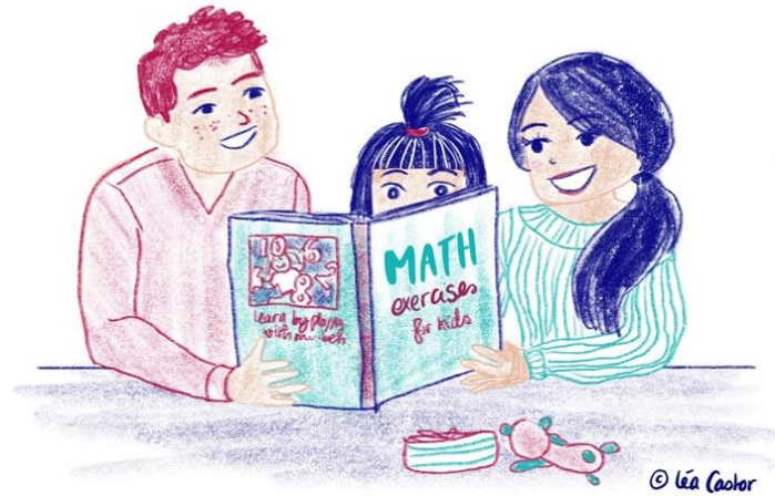
小孩適用的數學練習

們和家長們開始著手，因為他們對改變社會對女性在 STEM 中的觀點和刻板印象非常重要，同時他們也在小學、中學和高等教育中扮演鼓勵女性參與的重要角色。接著針對各種 科學或教育相關組織 提供建議，因為這些才是科學生活每天發生的地方。最後，我們對本研究計畫團隊成員-即 科學組織 及其他全球組織，提供建議。